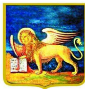
REGIONE DEL VENETO