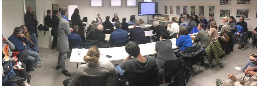
Una delle presentazioni del bando 6.4.2 nel territorio della Venezia Orientale. Qui, a Jesolo, ospiti della Confcommercio locale.

Publicato da VeGAL il nuovo bando del Programma di Sviluppo Locale (PSL) Leader 2014-2020 e relativo al Progetto Chiave Itinerari, per l'attuazione dell' Intervento 6.4.2 "Creazione e sviluppo di attività extra-agricole nelle aree rurali" .