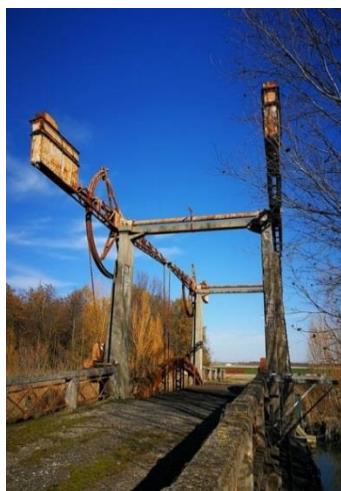
Menzione speciale “punto” (foto a sinistra): Lorenzo Zanardo con “Ruggine di un colorato passato” - Per l'interpretazione di un luogo-punto che attraversa linee, per unire superfici