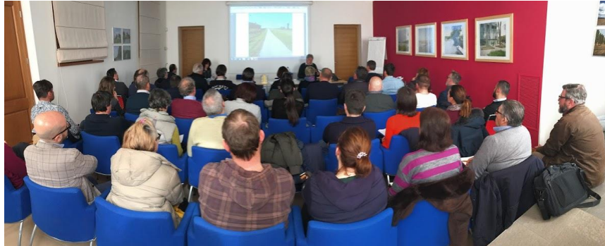
Un momento della presentazione pubblica del bando alle aziende agricole. Portogruaro, 6 marzo 2019

Presentati mercoledì 6 marzo 2019, nella sede VeGAL di Portogruaro, i tre bandi rivolti agli agricoltori, relativi agli interventi 4.1.1 “Investimenti per migliorare le prestazioni e la sostenibilità globali dell’azienda agricola” e 6.4.1 “ Creazione e sviluppo della diversificazione delle imprese agricole ”, suddiviso nei due Progetti Chiave “Itinerari” e “Parco Alimentare”.