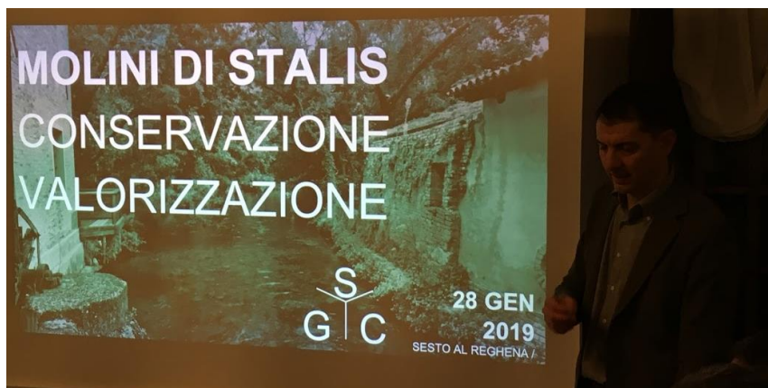
Sala consiliare del Comune di Sesto al Reghena, 28 gennaio 2019

Si è tenuto lunedì 28 gennaio 2019, nella sala consiliare del Comune di Sesto al Reghena in provincia di Pordenone, il Tavolo di Lavoro dedicato alla conservazione e valorizzazione dell'area dei Molini di Stalis in comune di Gruaro.