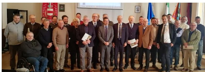
Concordia Sagittaria, 4 febbraio 2019. I sottoscrittori del Contratto.

Si è tenuta lunedì 4 febbraio 2019 nella Sala Consiliare del palazzo Municipale di Concordia Sagittaria (VE), la cerimonia di sottoscrizione del documento di intenti del Contratto di area umida "Sistema della Laguna di Caorle".