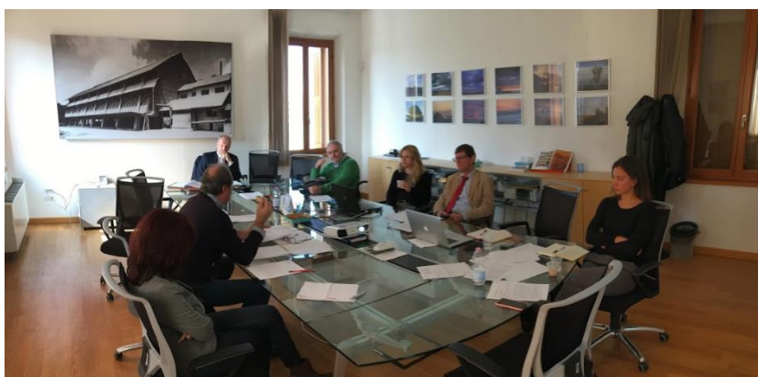
Portogruaro, 5 marzo 2019: Comuni, Regione, OGD e VeGAL si confrontano sulle strategie digitali per veicolare la “Venezia Orientale”.

Sulla base degli elementi tecnici emersi nel seminario “Promozione Turistica e Web Marketing: strategie per la Venezia Orientale”, organizzato da VeGAL a Portogruaro il 21.1.2019 e che ha avviato un confronto con i principali interlocutori dell'area con competenze nel settore turistico, nel primo quadrimestre 2019 VeGAL ha candidato un progetto per favorire la comunicazione del territoriale mediante gli strumenti digitali (misura 19.2.1x del PSL 2014/20).