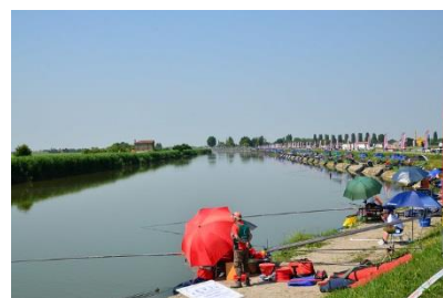
Menzione speciale “linea” (sopra): Giuseppe Ave con “Sport e natura” - Per aver colto una fruizione lineare, contemporanea e collettiva