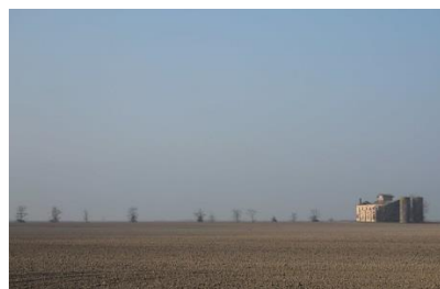
3° classificato: Luca Lucchetta con "Attesa" - Per essere riuscito ad andare oltre i cliché della bellezza del paesaggio ed evidenziarne anche gli elementi di disarmonia, che la fotografia ha il compito di portare sempre all'attenzione per un'approfondita analisi del territorio e una sua gestione lungimirante.