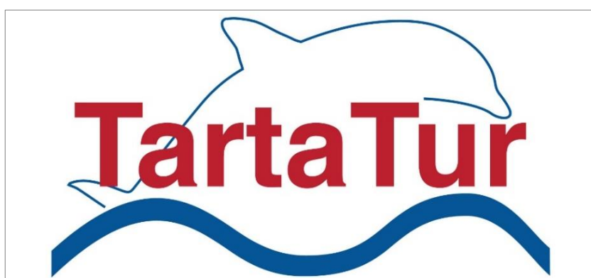
Il logo del progetto di cooperazione tra i FLAG dell'Alto Adriatico

I Gruppi di azione costiera (FLAG) del Distretto dell'Alto Adriatico - hanno firmato, il 24 gennaio 2019 presso la sede della Regione Veneto, l'accordo di cooperazione per individuare un percorso e le giuste misure per la tutela dell'ambiente marino, delle sue specie protette e nello stesso tempo difendere la pesca marittima e della maricoltura. I FLAG coinvolti nell'attuazione del progetto di cooperazione sono: il FLAG Veneziano , il FLAG Chioggia Delta del Po , il FLAG Costa dell'Emilia-Romagna ed il FLAG Friuli Venezia Giulia .