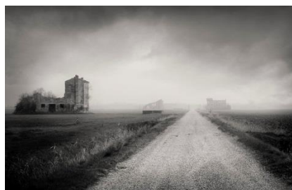
2° classificato: Dino Sutto con "Dalle rovine n.1" - Per la bella interpretazione delle case in rovina, quasi un richiamo ad un "capriccio" settecentesco.