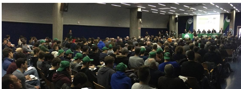
Un momento dell'evento CIA, aula magna dell'istituto Leonardo da Vinci

AGRICOLTORI ITALIANI DIAMO VALORE ALLA TERRA