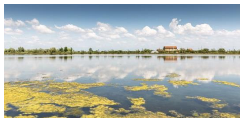
Menzione speciale “copertina” (foto sopra): Lorenza Cancian con “Laguna Lio Piccolo” - Per aver interpretato in un unico scatto il paesaggio e i suoi elementi fondanti, con un sapiente uso della luce e del colore