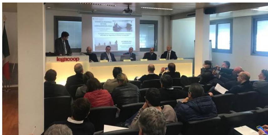
L'incontro nella sede di Legacoop Veneto del settore agroalimentare.

Venerdì 8 febbraio, nella sede di Legacoop Veneto si è tenuto un incontro del settore agroalimentare regionale per affrontare temi relativi al nuovo FEAMP (Fondo europeo per la pesca) e alla nuova Politica agricola comunitaria, tra i rappresentanti della Regione e delle istituzioni comunitarie presenti, per ascoltare le esigenze delle imprese cooperative del territorio Veneto.