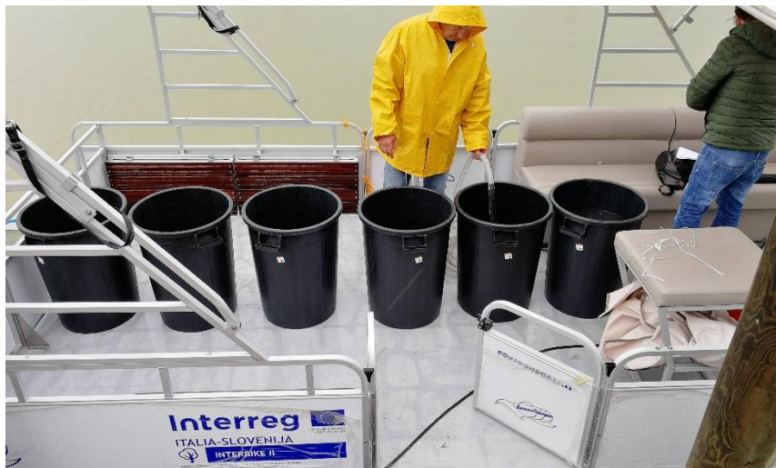
I preparativi dell'imbarcazione per il servizio bici-barca.

Procedono frenetiche le attività sul progetto Interbike II che permetteranno di avere finalmente il servizio di collegamento bici-barca da Porto Baseleghe (Bibione) e Vallevecchia (Caorle). Il 9 maggio è stato effettuato il collaudo dell'imbarcazione e nel giro di pochi giorni l'Ispettorato di Porto rilascerà i documenti definitivi per la navigazione.