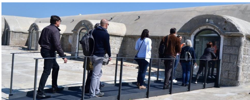
La visita alla Batteria Vittor Pisani di Cavallino-Treporti con i partner sloveni.

Procede l'attività del progetto Interreg ITA-SLO “Walk of Peace (Sentiero della Pace)”. Nato dalla volontà di contribuire alla commemorazione delle vittime della Prima Guerra Mondiale e promuove i valori della pace e del rispetto, il progetto vuole anche promuovere il turismo culturale delle aree coinvolte nel primo conflitto bellico. Dopo l'incontro di “Kick of Meeting” tenutosi il 6 dicembre dello scorso anno a Kobarid (SLO) e l'incontro operativo del 18 gennaio 2019 con i partner (Regione Veneto, i Comuni