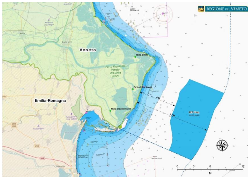
Mapa dell'area SIC Alto Adriatico (fascia marina veneta) ambito del progetto

Si concluderà ad aprile 2020 un importante progetto di cooperazione promosso dai Gruppi di azione costiera (FLAG) del Veneto: il FLAG Veneziano , in qualità di capofila e il FLAG Chioggia Delta del Po .