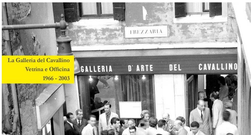
La locandina della nuova mostra inaugurata al MuPa di Boccafossa

Si è inaugurata sabato 5 ottobre 2019 al MuPA (Museo del Paesaggio) di Boccafossa di Torre di Mosto - VE, la mostra “La Galleria del Cavallino. Vetrina e Officina. 1966–2003” , dedicata all’attività della Galleria del Cavallino dal 1966 fino alla sua chiusura nel 2003.