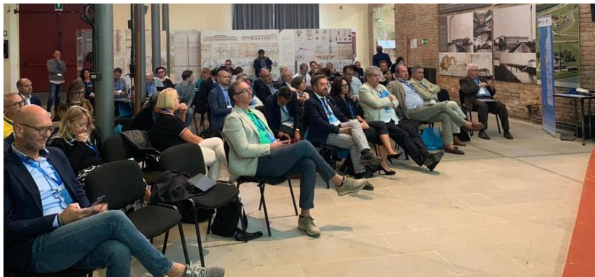
Nella foto, un momento del VII seminario nazionale dei FLAG.