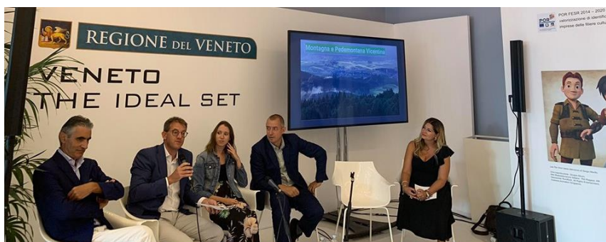
Evento di presentazione del progetto “Veneto Rurale” alla 76esima Mostra Internazionale del Cinema

Presentato alla Mostra del cinema di Venezia il progetto di cooperazione “Veneto Rurale”, iniziativa che si pone l'obiettivo di promuovere cinque territori rurali veneti: Alta Marca Trevigiana, Colli Euganei e Bassa Padovana, Montagna Vicentina, Medio Polesine e