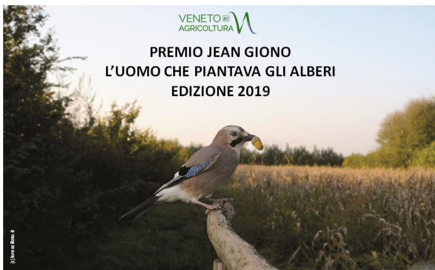
La locandina del premio indetto da Veneto Agricoltura