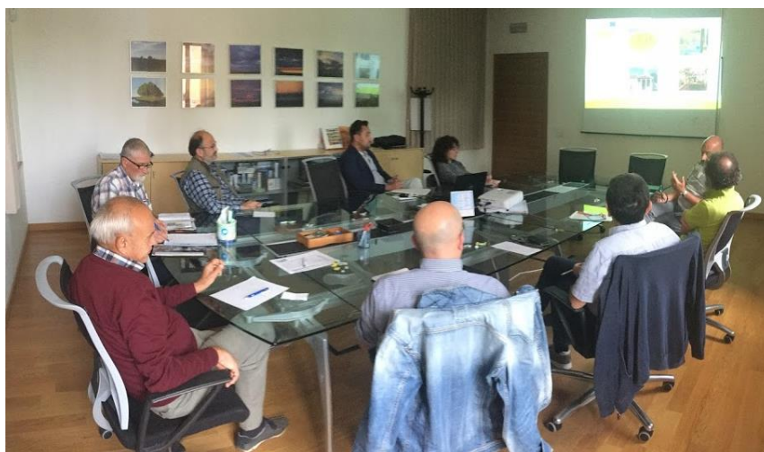
L'incontro del gruppo di lavoro PRIMIS riunito a Portogruaro il 24.09.2019

Proseguono le attività del progetto di cooperazione Italia-Slovenia "PRIMIS" , iniziativa che si pone l'obiettivo di valorizzare il patrimonio linguistico, culturale e naturale comune delle minoranze dell'area, per attrarre un turismo culturale sostenibile.