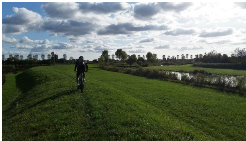
L'immagine di VeGAL, premiata al concorso fotografico.

"EUROPE IS YOU - L'EUROPA SEI TU", è il titolo del concorso fotografico amatoriale organizzato dal Punto di contatto nazionale del Programma Interreg Central Europe nell'ambito della campagna per la Giornata della Cooperazione Europea 2019 (EC Day).