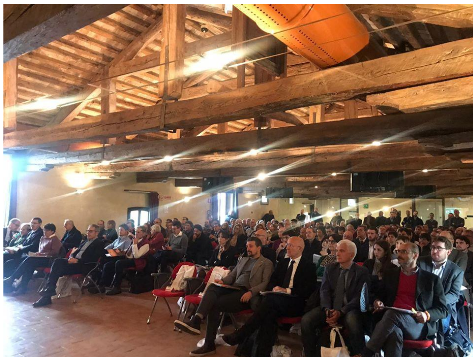
Un momento del convegno del 29 novembre 2019 a Legnaro.

Si è tenuto alla Corte Benedettina di Legnaro, il 29 novembre 2019, un convegno che ha permesso di presentare i primi risultati del PSR 2014/20, in vista della PAC 2021/27.