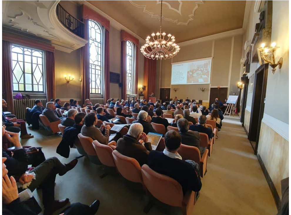
La sala Ronchi del Consorzio di Bonifica a San Donà di Piave, durante la presentazione del Masterplan.

È stato presentato sabato 7 dicembre 2019 nella Sala Ronchi del Consorzio di Bonifica del Veneto Orientale il Masterplan della mobilità sostenibile, progetto finanziato all'80% dalla Regione Veneto con la LR 16/93 e per il 20% dai Comuni del Veneto Orientale.