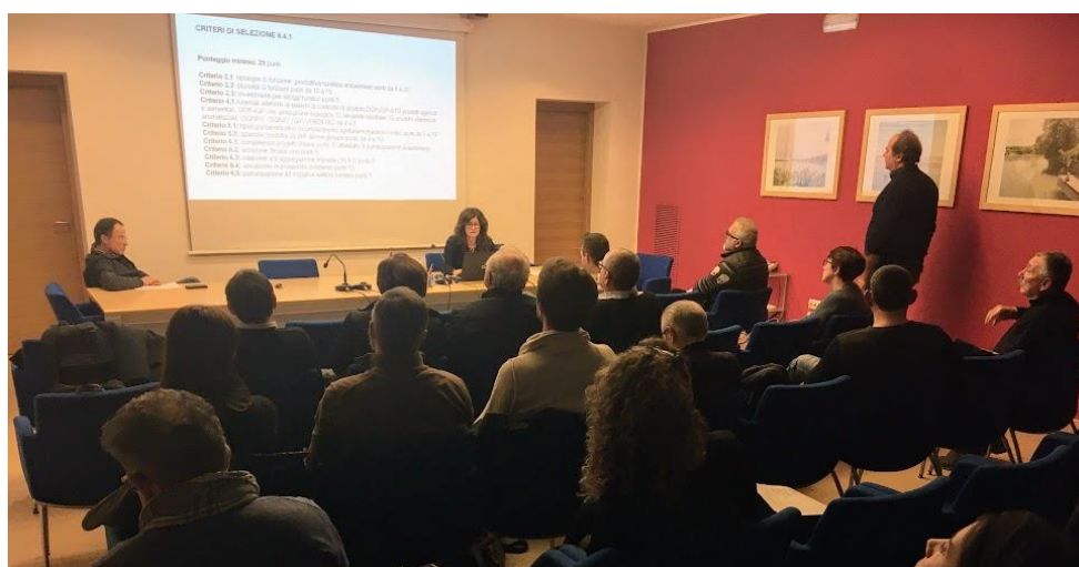
Un momento del seminario di presentazione dei bandi

Si è tenuto giovedì 19 dicembre 2019 nella sede di VeGAL il percorso informativo sul Progetto Chiave Itinerari (PSL “Punti Superfici Linee nella Venezia orientale”) in vista dell’apertura dei bandi per l’intervento 6.4.1 “Creazione e sviluppo della diversificazione delle imprese agricole” rivolto agli imprenditori agricoli.