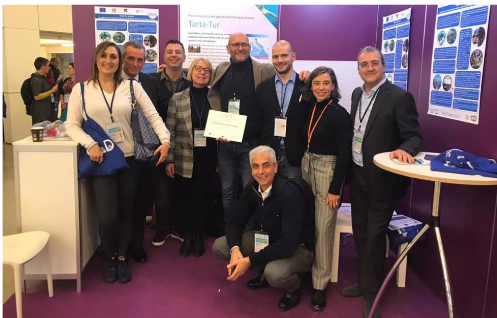
Foto di gruppo a Bruxelles dopo aver ricevuto il premio per il progetto Tarta-Tur.

#cooperazione #feamp #FARNET #UE flag veneziano