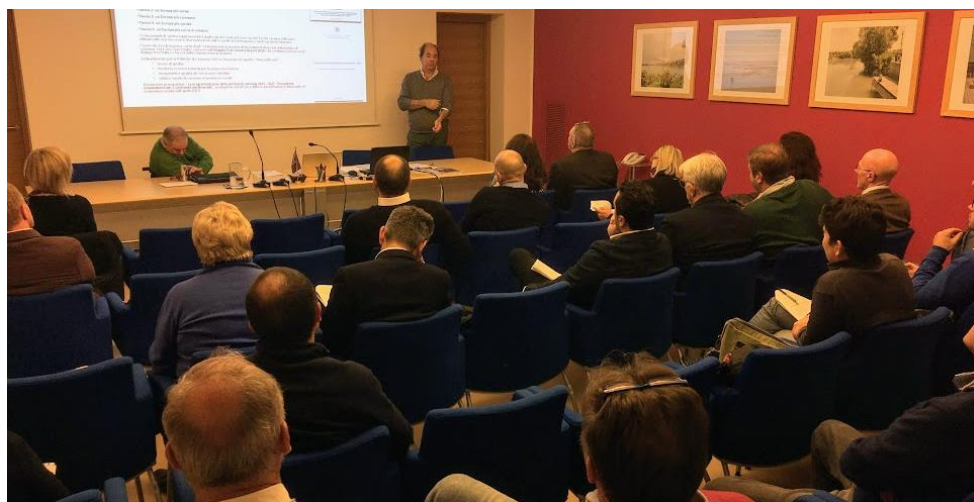
Nella foto, la sala conferenze di VeGAL durante l'Assemblea dei soci