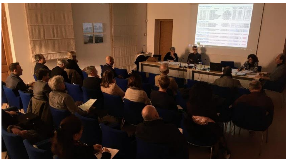
Nella foto, un momento dell'incontro con Avepa del 4.12.2019

Giunti quasi alla scadenza della realizzazione del primo blocco di progetti di infrastrutture finanziate da VeGAL ai Comuni dell'area, VeGAL ha invitato il 4.12.2019 presso la propria sede i Comuni interessati e Avepa, per un confronto sulle procedure di attuazione dei progetti da parte delle amministrazioni pubbliche e le relative rendicontazioni.