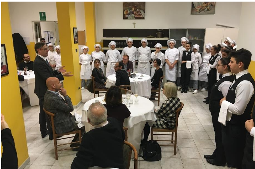
Un momento dell'incontro che si è tenuto nella Scuola Lepido Rocco di Pramaggiore

Il 31 gennaio 2020 saranno trascorsi 25 anni dalla costituzione di VeGAL avvenuta il 31 gennaio 1995: una ricorrenza importante per la nostra struttura, per ricordare la quale il Consiglio di Amministrazione di VeGAL ha voluto organizzare un incontro con i precedenti Presidenti e Vicepresidenti che hanno guidato l'Associazione nei vari mandati elettivi.