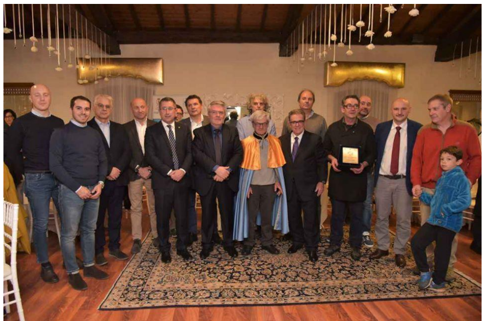
Foto di gruppo alla serata conclusiva a Villa O'Hara

Si è conclusa venerdì 22 novembre 2019 la 4ª edizione del Premio “Bisàt d'Argento” , la rassegna enogastronomica dedicata ai sapori della pregiata anguilla “Liventina” e delle specialità autoctone dei territori limitrofi al basso corso del fiume Livenza.