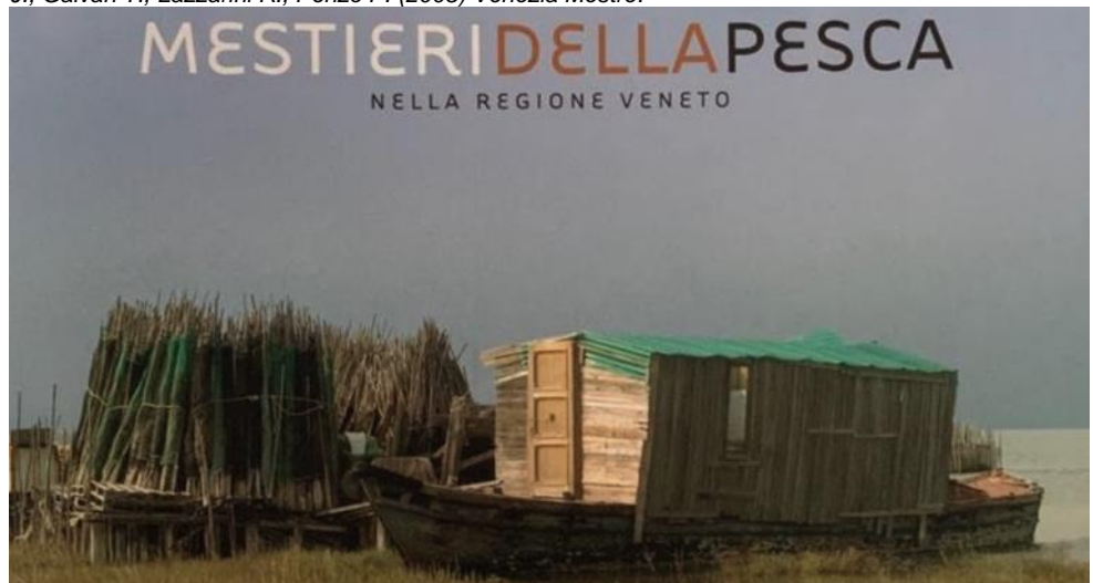
Immagine dal volume "Mestieri della Pesca nella Regione Veneto" Pellizzato M., Vendramini A., Favretto J., Galvan T., Lazzarini R., Penzo P. (2005) Venezia Mestre.

Il progetto, con un budget totale di 337.700,00€ , è attualmente in istruttoria, fase che si dovrebbe concludere nel primo quadrimestre 2020. La conclusione è prevista entro agosto 2022.