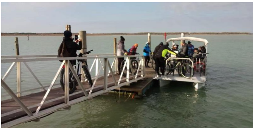
Una fase dell'imbarco di cicloturisti durante una delle escursioni sperimentali di questo inizio 2020.

Nuovo passo barca tra Bibione e Vallevecchia, un progetto per il cicloturismo del litorale: approvato dal Comune di San Michele al Tagliamento l'avvio di un nuovo passo barca tra Bibione Porto Baseleghe e Vallevecchia (Brussa) che permetterà ai cicloturisti di scoprire i paesaggi lagunari con la propria bici al seguito, mediante l'imbarcazione di VeGAL "Adriabike", che permette il trasporto di sette persone, attraversando la laguna veneta da Bibione a Caorle.