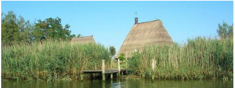
Un casone lagunare a Caorle

L' ittiturismo è un'attività di ospitalità e di somministrazione esercitata da imprenditori ittici singoli o associati, connessa e non prevalente rispetto a quella principale di pesca o acquacoltura, svolta attraverso l'utilizzo della propria abitazione o di strutture nella disponibilità dell'imprenditore: una definizione precisa quella fornita dalla LR n. 28/2012 della Regione Veneto per questa attività di diversificazione per il settore della pesca, ma che tuttavia ha dimostrato parecchie difficoltà a decollare, in particolare nell'area costiera del Compartimento marittimo Veneziano.