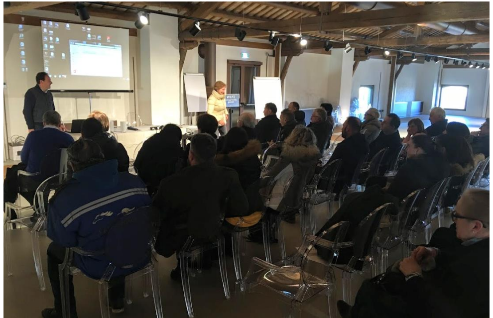
Un momento della giornata di aggiornamento rivolta alla Fattorie didattiche.

Si è tenuta a Caorle, mercoledì 5 febbraio 2020, nell'ambito delle giornate di aggiornamento organizzate dalla Regione Veneto , una giornata di formazione rivolta alle fattorie didattiche dal titolo " Storie di Acqua, di uomini e cibo ".