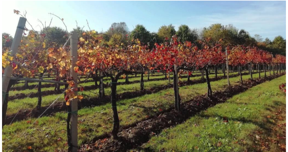
Vigneti di pianura, immagine di Serena Bet dal 3° Concorso fotografico di VeGAL.

Al via un nuovo progetto per l'agroecologia: si tratta del progetto ECOVINEGOALS (acronimo di: Ecological Vineyards Governance Activities for Landscape's Strategies), finanziato nell'ambito del Programma Interreg ADRION 2014 – 2020 .