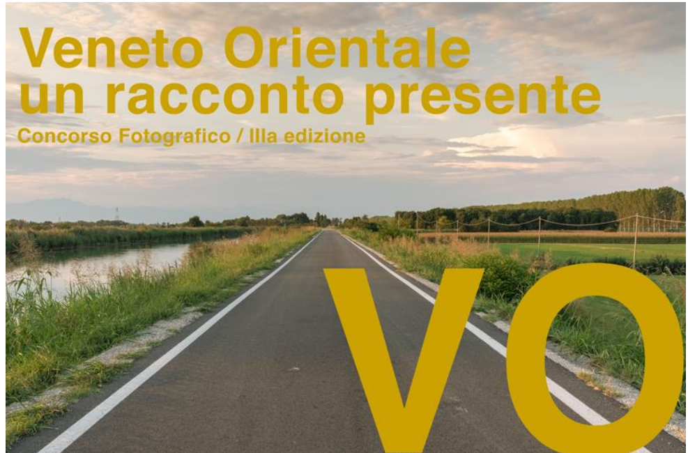
La locandina della IIIª edizione del concorso fotografico organizzato da VeGAL.

VeGAL , nell'ambito delle attività di Comunicazione del PSL 2014-20, ha organizzato nel 2019 la terza edizione del Concorso Fotografico "Veneto Orientale: un racconto presente" .